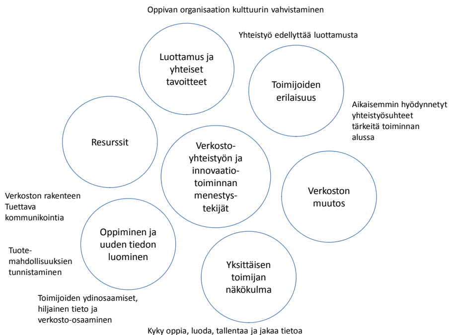
Kuva 5. Yhteenveto menestystekijöistä.

Innovatiivinen verkostoyhteistyö vaatii toimijoilta yhteisesti hyväksyttyä näkemystä verkoston tulevaisuudesta (Pikka & Kess 2005; Vesalainen & Kohtamäki 2009). Yhteistyö edellyttää kuitenkin ennen muuta luottamusta ja siten innovaatioprosessin ideointivaiheessa jo olemassa olevat ja aikaisemmin hyödynnetyt yhteistyösuhteet ovat avainasemassa (Miettinen et al. 1999; Pikka & Kess 2005). Oppivan organisaation kulttuurin vahvistaminen tukee myös liiketoimintamahdollisuuksien tunnistamista ympäristön muutoksista sekä asiakkaiden parissa vaikuttavista trendeistä ja asiakkaan tarpeista (Cagan & Vogel 2003; Möller & Rajala 2009).