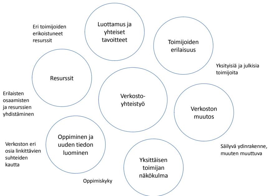
Kuva 3. Yhteenveto verkostoyhteistyöstä.